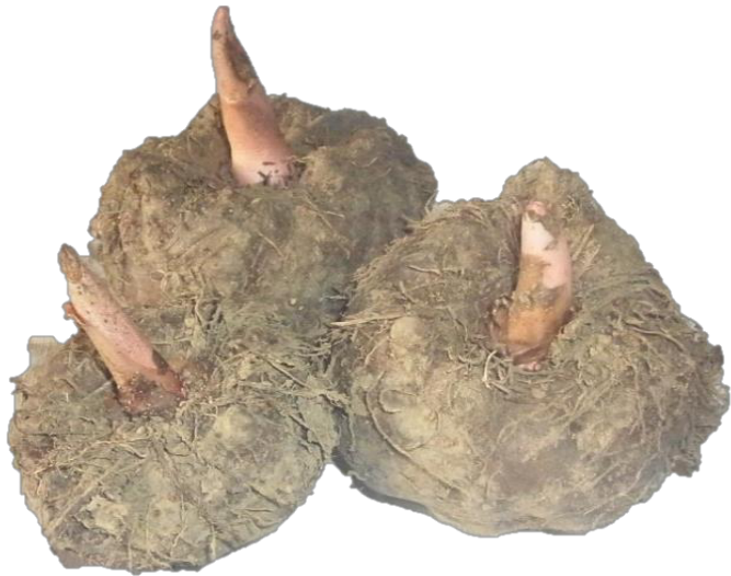
原材料（こんにゃく芋）