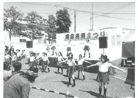
地元グループのダンス