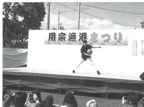
フリースタイルバスケット